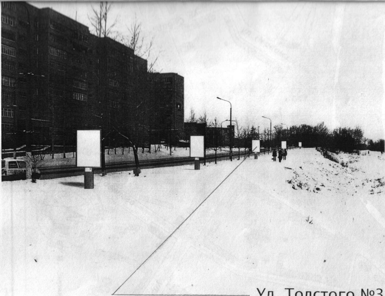
Ул. Толстого №3